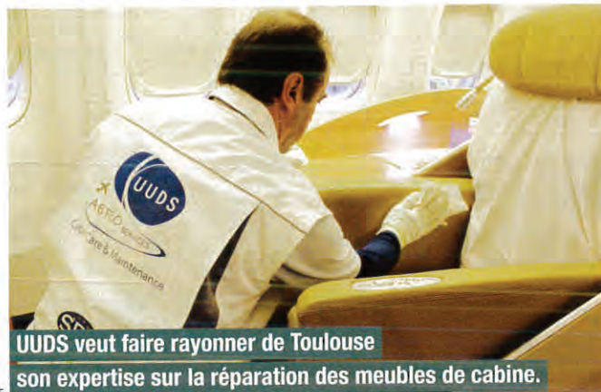
UUDS veut faire rayonner de Toulouse son expertise sur la réparation des meubles de cabine.

Une consolidation toulousaine qui doit permettre à cette filiale de grandir en taille et en maturité, pour être capable de vendre son expertise sur la réparation de meubles ailleurs en France et à l'export, notamment en Chine et au Moyen-Orient, où UUDS s'est implanté en